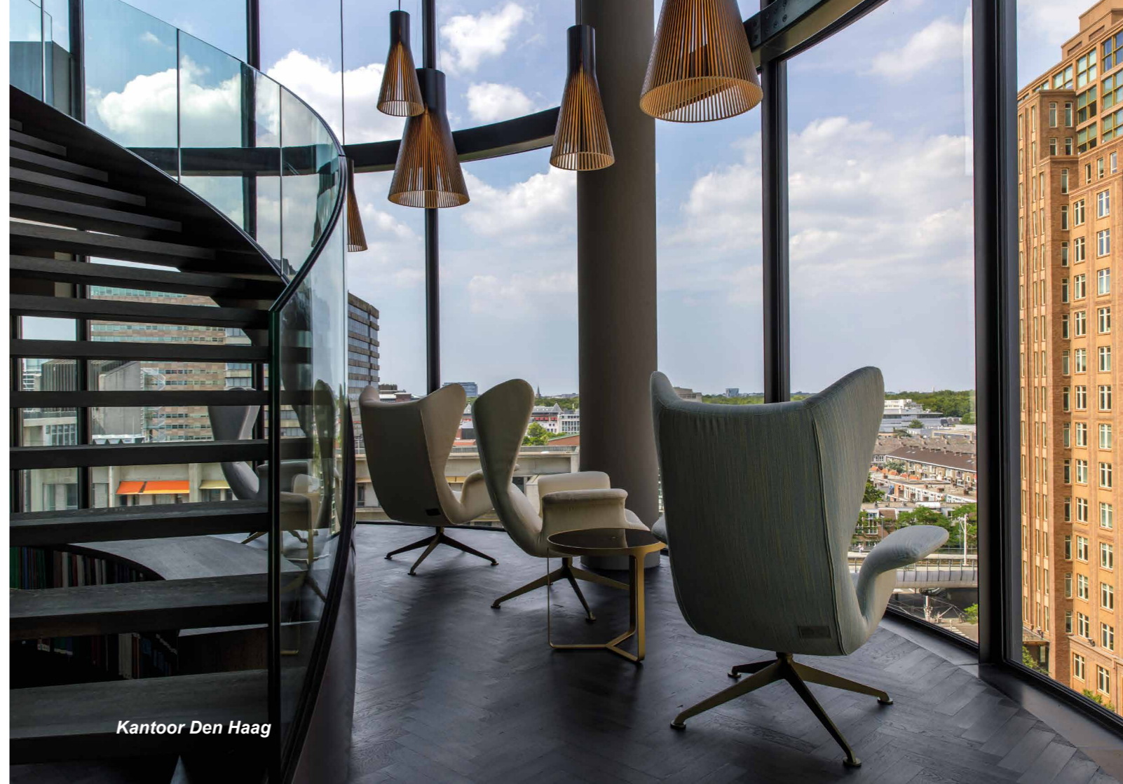
Kantoor Den Haag

De sectie Corporate Litigation & Dispute Resolution kent diverse specialisten op dit gebied. Kijk op de website voor meer informatie.